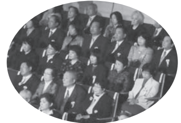
全国学校保健大会表彰式にて

この度、新潟で開催された第58回全国学校保健研究大会において、文部科学大臣表彰を賜りました。私の様な者には恐れ多く、新潟県養護教員研究協議会が誕生してから50周年という節目の年に、諸先輩や会員の皆様の実践が評価され、代表として賜ったものと受け止めております。これまで、会員として多くの事を勉強させていただき、組織の大切さと、一人一人が協力することの重要性を学ばせていただきました。同時に、当会は、養護教諭としての自己を映す原点の場として、心の拠り所でもありました。今後も、子供の心のつぶやきを聞き取れる感性を持って日々研鑽を積んでいきたいと思っております。本当にありがとうございました。