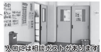
入口には相談ポストがあります